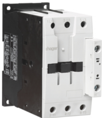
Контактор корпусний 3P, 24В-DC, 72А AC-3

Подібне зображення (Показ зображень EVXX_SIZE3_3P)