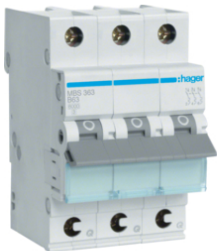
Автоматичний вимикач QC 3P 6kA B-63A 3M