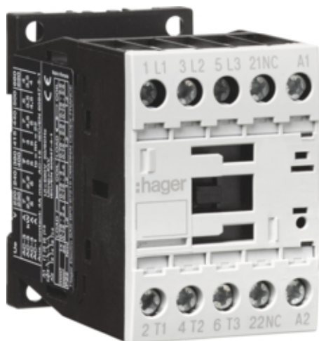
Контактор корпусний 3P + 1N3, 230В-АС, 15.5А АС-3

Подібне зображення (Показ зображень EVXX01_SIZE1_3P)