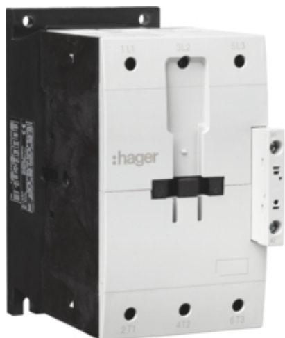
Контактор корпусний 3P, 230В-АС, 150А АС-3

Подібне зображення (Показ зображень EVXX_SIZE4_3P)