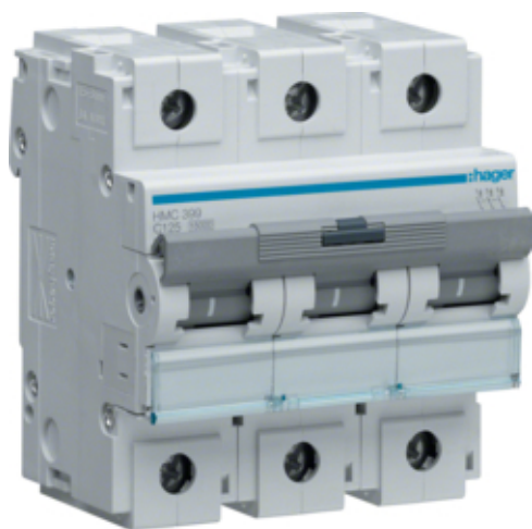
Автоматичний вимикач 3P 15kA C-125A 4.5M