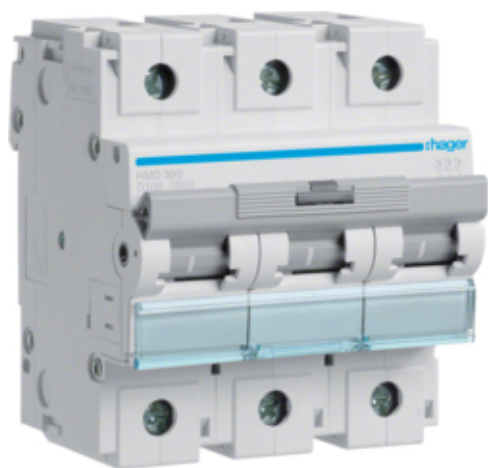
Автоматичний вимикач 3P 15kA D-100A 4.5M