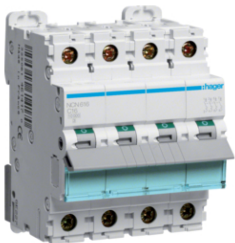
Автоматичний вимикач 3P+N 10kA C-16A 4M