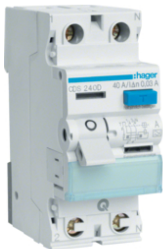
ПЗВ QC 2P 40A 30mA A