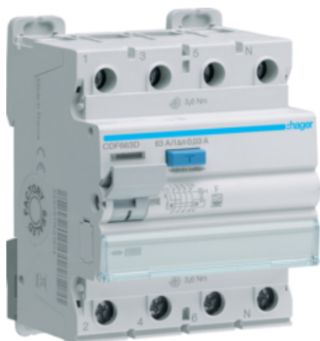
ПЗВ 4Р 10kA 63A 30mA F