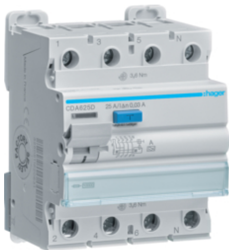
ПЗВ 4Р 10kA 25A 30mA A