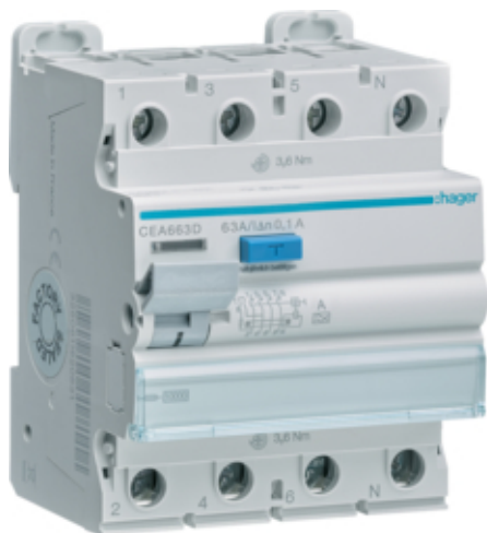
ПЗВ 4Р 10кА 63А 100мА А