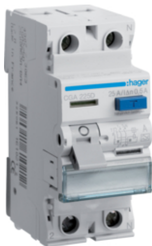
ПЗВ 2Р 6кА 25А 500мА А