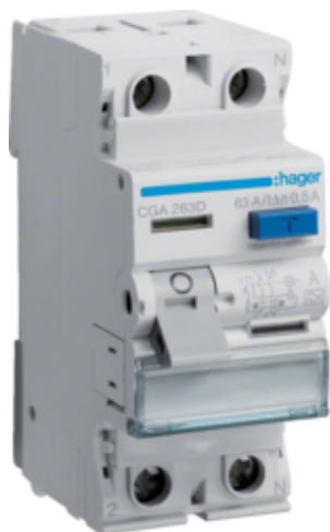
ПЗВ 2Р 6кА 63А 500мА А